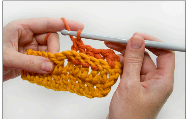
Kuva 4. Ota lanka koukulle ja vedä lanka pylvään varren ali. Ota lanka koukulle ja vedä kahden silmukan läpi. Ota lanka koukulle ja vedä loppujen kahden silmukan läpi.