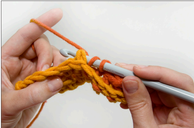
Kuva 3. Ota langankierto koukulle. Ota edellisen kerroksen pylvään varsi koukulle työn takana.