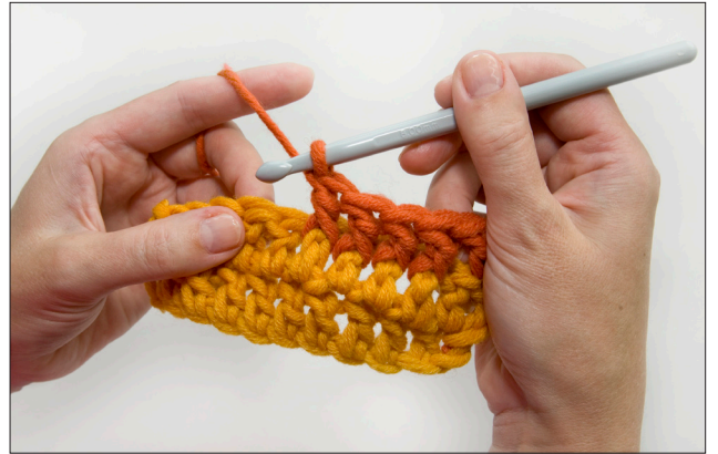
Kuva 2. Ota lanka koukulle ja vedä lanka pylvään varren ali etupuolelle. Ota lanka koukulle ja vedä kahden silmukan läpi. Ota lanka koukulle ja vedä loppujen kahden silmukan läpi.